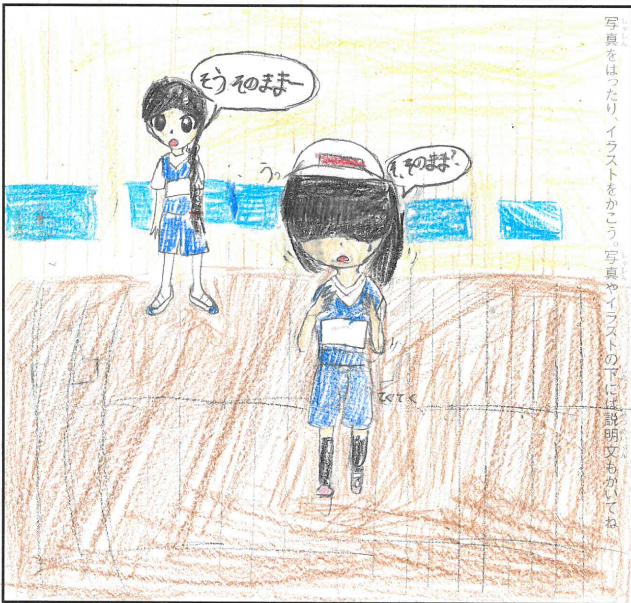
写真をはったり、イラストをかこう。写真やイラストの下には説明文もかいてね