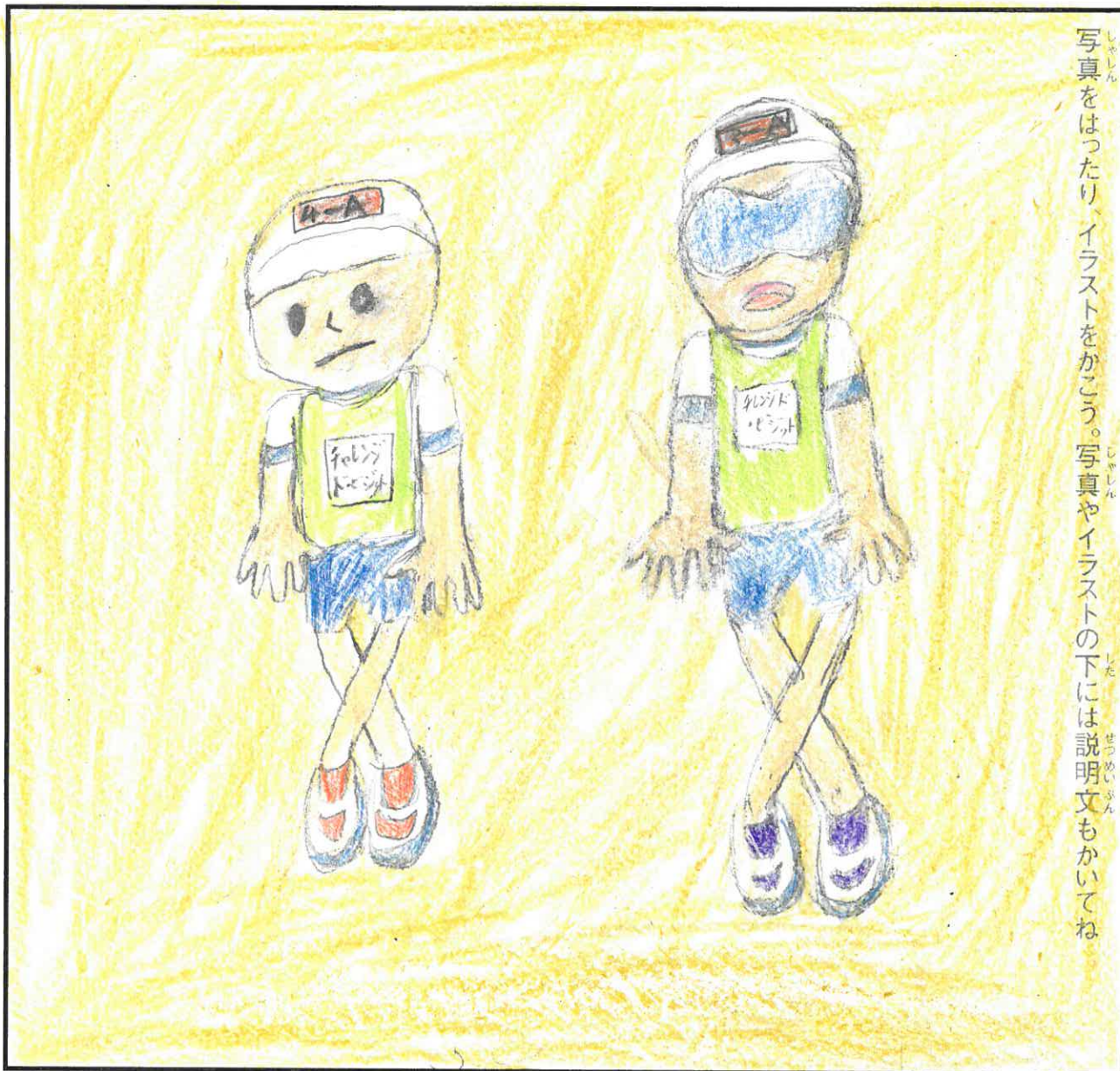
写真をはったり、イラストをかこう。写真やイラストの下には説明文もかいてね