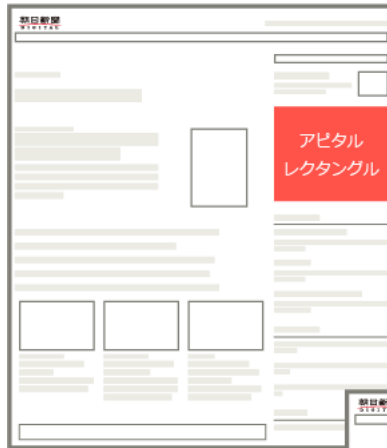
— 朝日新聞デジタル (アピタルトップページ) —