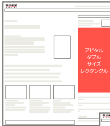
— 朝日新聞デジタル (アピタルトップページ) —