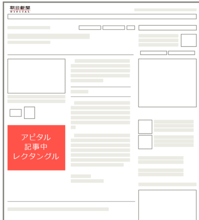
— 朝日新聞デジタル（アピタル記事ページ） —

医療・健康についての特集、「アピタル面」の記事内に掲出されるレクタングル広告です。医療記事閲覧者にしぼって訴求することができます。記事につく写真の下に掲出されるため、読者の目にも入りやすく、高いCTRを誇ります。