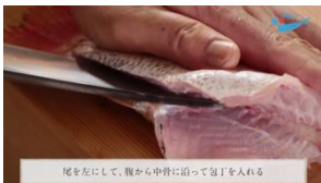
分かりやすいカメラアングル 喉黒（のどぐろ）