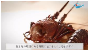
甲殻類や貝類の下処理も網羅 伊勢えび