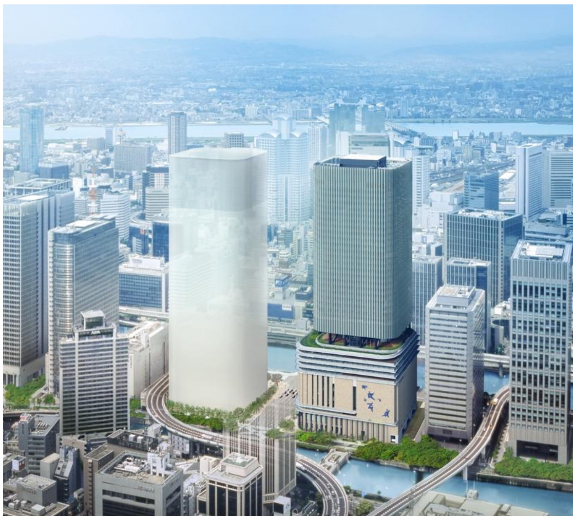
西地区のイメージ図（左）と中之島フェスティバルタワー