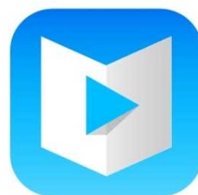
「アルキキ」アイコン

株式会社朝日新聞社(代表取締役社長:渡辺雅隆)は本日、新聞を「聞く」スマートフォンアプリ「アルキキ」の提供を始めました。「朝は忙しくて新聞を読む時間がない、けれども大事なニュースは知っておきたい」ビジネスパーソンにぴったりの無料アプリで、歩いている時や満員電車の中などでも最新のニュースが聞けます。App Store (iOS版)と Google Play (Android版)でダウンロードできます。