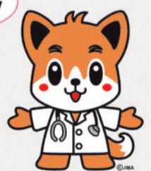
日本医師会キャラクター「日医君」

【募集作品】 広報活動・メディア等で使用するロゴマークを募集。明るく、親しみのもてるロゴマークを制作し、その制作意図を添えてご応募ください。