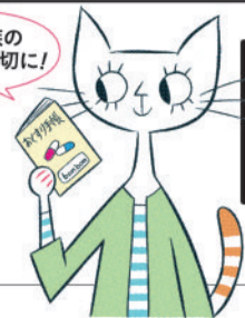
illustration by Akira Sorimachi